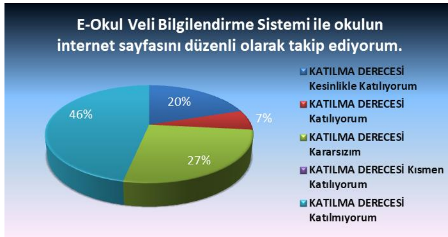
Şekil 7: E-Sistemler takip durumu.

Sorusuna anket çalışmasına katılan velilerimizin %87’si Katılıyorum yönünde görüş belirtmişlerdir.