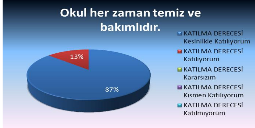
Şekil 6: Okul her zaman temiz ve bakımlıdır.

Okulumuzda öğrenim gören öğrencilerin velilerine yönelik gerçekleştirilmiş olan anket çalışması sonuçları aşağıdaki gibidir.